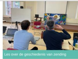
Les over de geschiedenis van zending