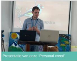
Presentatie van onze 'Personal creed'