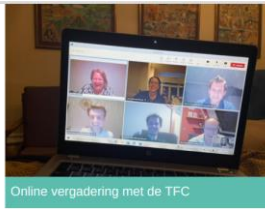
Online vergadering met de TFC