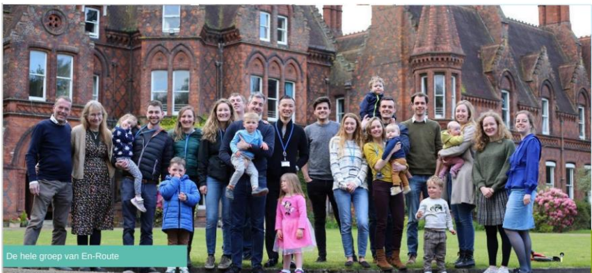
De hele groep van En-Route

Meer informatie vindt u op de website van de GZB (dit kan ook via onze eigen gemeente, meer info vindt u in de folder of via iemand van de zendingscommissie – zie website www.hervormdherwijnen.nl ).